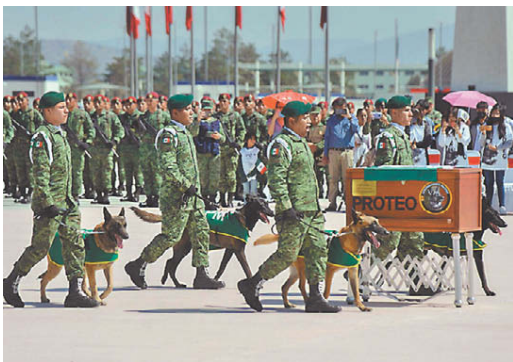
Su manejador encabezó la guardia de honor.