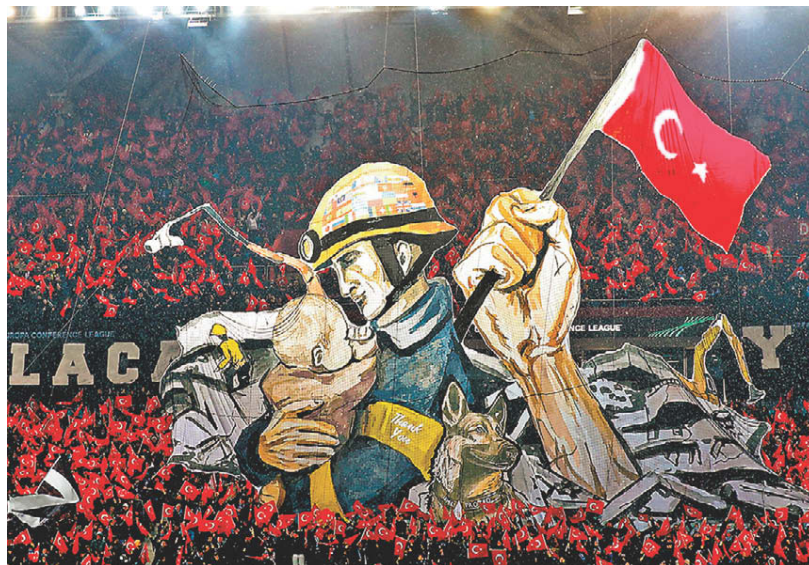
Aficionados del equipo turco de futbol Trabzonspor rindieron homenaje a Proteo, durante un encuentro ayer contra el Basilea, como parte de la UEFA Conference League.

"Se apagaron tus lamentos (...) se acabaron los juegos, el adiós, el llanto, tenerlo. Siento tu pérdida, mi querido amigo, y ver solo esa correa me dará recuerdos inolvidables. ¡Misión cumplida, campeón!", dijo su entrenador. PÁG. 17